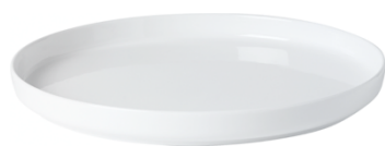
Diamètre: 29 cm

Notre partenaire Villeroy & Boch met à disposition des participant-e-s la vaisselle de la ligne «Affinity» pour la présentation des plats. Lors de la rencontre des finalistes du 9 mars 2026, un set sera remis aux participant-e-s pour qu'ils puissent s'exercer au dressage. Les plats peuvent uniquement être dressés sur l'assiette et le bol mis à disposition. Toute décoration ou assiette de présentation supplémentaire est interdite.