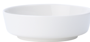
Diamètre: 15 cm, volume: 0,46 l